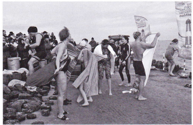
Abtrocknen und aufwärmen

stalter haben aus ihren Erfahrungen gelernt. Auch wenn es lustig anzusehen ist, wenn die Unverwüstlichen ins kalte Wasser steigen, der Rückweg ist hart, sehr hart. Um den Mut der Schwimmwütigen zu belohnen, hatten Mitglieder des Fremdenverkehrsverein Pellworm eine mobile Sauna gechartert, in der sich die „Abgekühlten“ direkt nach dem