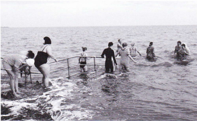
Anbaden bei Null Grad Wassertemperatur